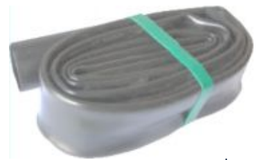
Трубки жильні (рулон)