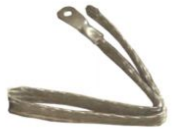
Провід заземлення з накінецьником