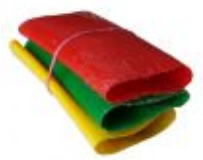
Манжети кінцеві, манжети пальцеві, манжета поясна