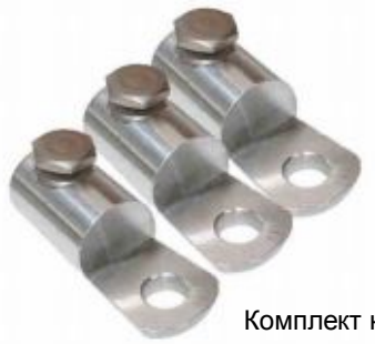
Комплект накінецьників гвинтових